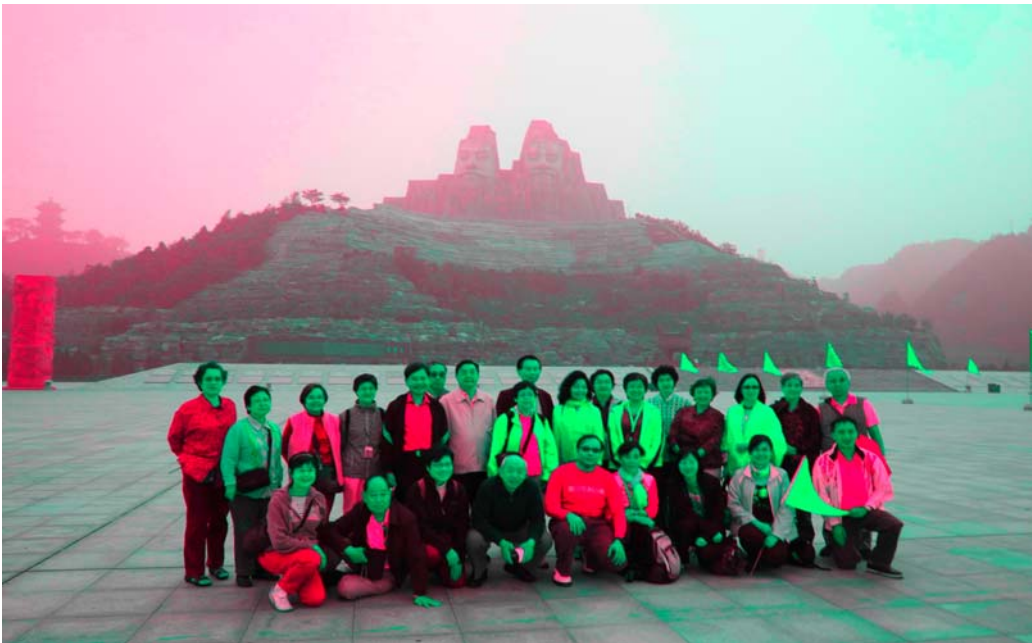
團員攝於黃河公園 炎黃二帝石像